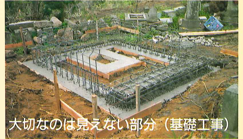
大切なのは見えない部分 (基礎工事)

富士墓石本舗の蓄積された技術 ノウハウより生まれた土圧遮断工法による墓所外柵は何年経っても ビクッ ともしません。