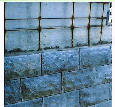
アール壁と石との取り合い