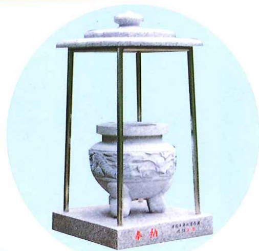
石とステンレス柱の組合せ