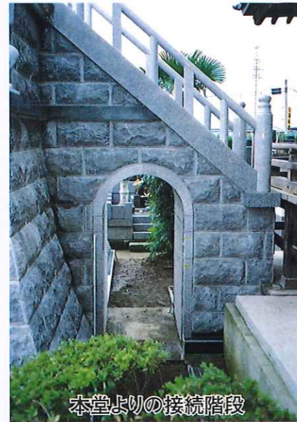
本堂よりの接続階段

施工場所 群馬県高崎市上小埜町曹洞宗大森院放光禅寺境内 設計、施工 富士墓石本舗 富士特殊基礎(株)