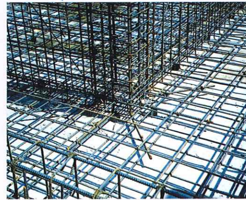
鉄筋加工取付工事