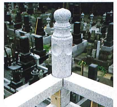
疑宝珠隅柱の納り例