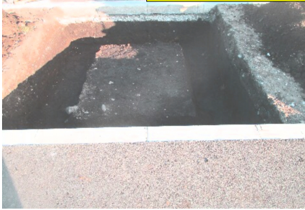
根伐 砕石敷込填圧 鉄筋配筋

敷地 1500*2000mm 基礎 四方先端折下鉄筋コンクリート 外柵 袴付き白御影外柵 石塔 和式インド黒御影伏蓮華加工、黒芝台 袴、床石G-654 曹洞宗使用